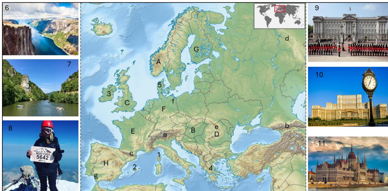
Fig. 3 Europa – elemente geografice

Analizați harta și imaginile de mai jos, unde cu cifre de la 1 la 3 sunt reprezentate insule, 4 și 5 sunt peninsule, de la a la f sunt unități de relief, iar de la A la H sunt țări. Imaginile notate cu numere de la 6 la 11 sunt diverse imagini din Europa.