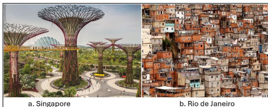
Fig. 2 Așezări urbane

În imaginile alăturate sunt surprinse ipostaze din două orașe recunoscute pe plan internațional: Singapore – „cel mai verde oraș din lume” și un cartier sărac din Rio de Janeiro.